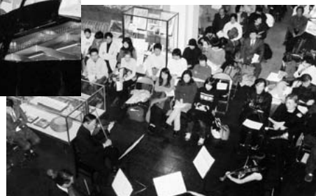
満員のコンサート会場