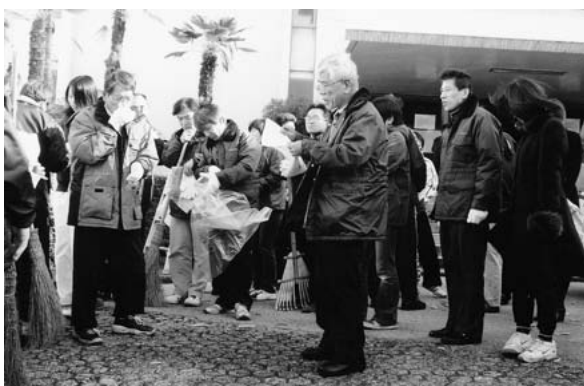
各々の清掃場所に向かう事務局職員 (事務局2号館玄関前)

事務局では、12月19日（金）、約80名の事務局職員が一齐に東山キャンパス構内及び周辺の市道に分かれ、清掃、側溝に詰まった泥土、枯れ葉の除去及び不要な立看板、ビラ等の撤去等の作業を行いました。事務局職員は、寒空のもと、防寒着を身にまとい、構内に落ちている多くの枯れ葉を一生懸命に収集していました。