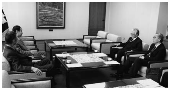
松尾総長と懇談する赫東北大学学長(左から二番目)