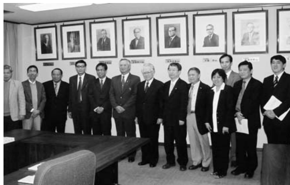
総長表敬訪問での記念撮影