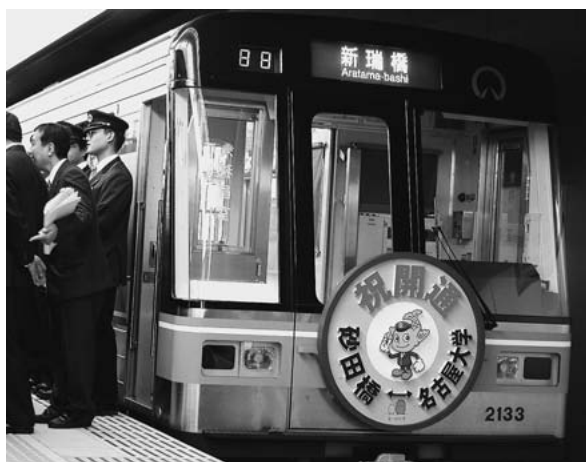
名城線「砂田橋 - 名古屋大学」間開通

新たに、茶屋ヶ坂駅、自由ヶ丘駅ともに開業した「名古屋大学」駅は、全国でも珍しく、大学構内に設けられています。このため、名古屋市交通局と本学が協力して、大学構内の景観にあったデザインになるように配慮しました。なお、残る「名古屋大学 - 新瑞橋」間は、平成16年度完成の予定で、開通すれば、全国初