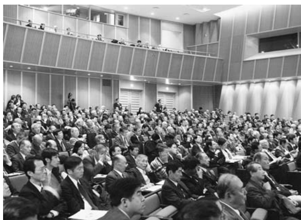
会場を埋め尽くす参加者