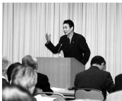
細川中部経済産業局長のあいさつを代読する車田産業企画部長