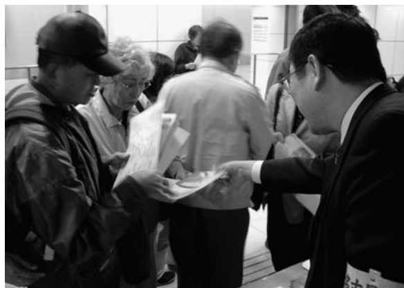
名古屋大学駅でキャンパスマップ等を配布する企画広報室員

また、当日及び翌14日の2日間、開通を記念したコリカ、切手及びグッズ等の販売をする市交通局、郵便局及び本学消費生活協同組合（名大生協）とともに、企画広報室員が名古屋大学駅コンコースで、本学が実施する地下鉄開通記念イベントのチラシ（医工連携シンポジウム（6頁参照）、学内展覧会 strange x familiar）、リーフレット、キャンパスマップ等を配布し、本学をアピールしました。両日とも、多くの市民が同駅を訪れ、キャンパスマップを手に取り、大学構