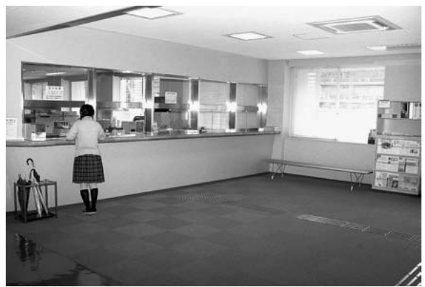
大学院学生窓口（2階）