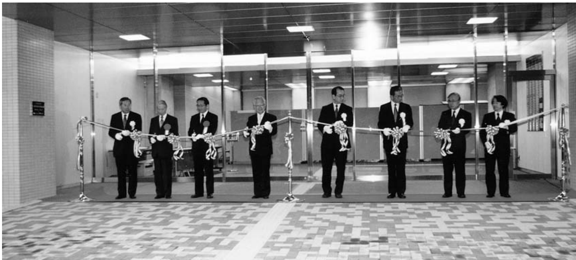
玄関前でのテープカット