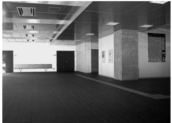
玄関・ラウンジ（1階）

式典後、同館の1～7階の各実験室、災害対策室及 び講義室等の施設見学、ラウンジにおいて、祝賀会が 行われました。