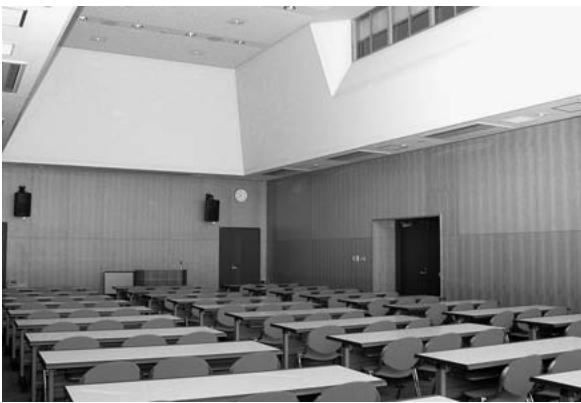
レクチャーホール（1階）