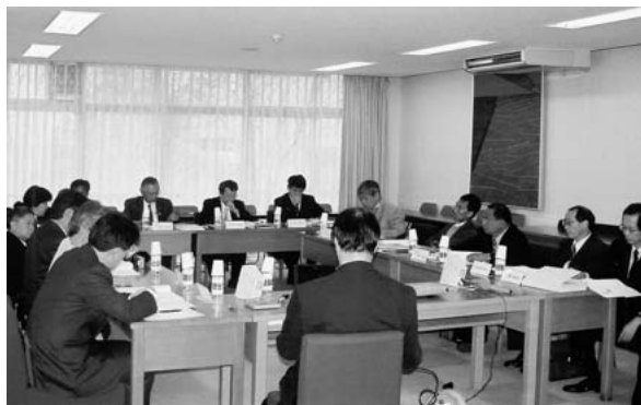
AAACU 理事会の様子（農学部大会議室）

なお、本学が担当する第15回大会は、「アジア農科系大学連合における遠隔教育のための E-learning System の確立」をテーマに、2004年9月27日から30日までの4日間、シンポジオンホールを会場に開催される予定です。