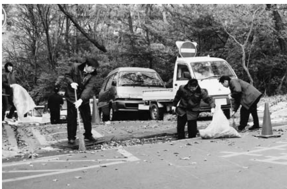
側溝の枯れ葉を収集する事務局職員